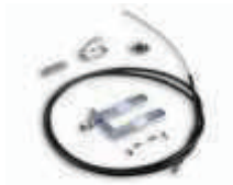
SPA 2 zestaw wysprężalnia z zewnątrz do SPIN/SPIDO