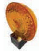
ML24 lampa sygnalizacyjna 24V z wbudowaną anteną 433.92 MHz