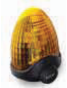
LUCY24 lampa sygnalizacyjna 24V