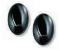
BF fotokomórka (para) zasięg 15-30m