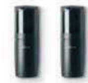
FT210 fotokomórki (para-bez baterii), nastawne z kątem 210°, zasięg 15 m