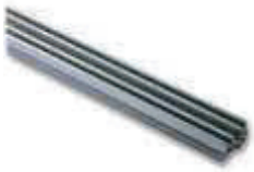
SPA 21 przedłużenie szyny 1 m z łańcuchem i spinką do SPIDO/SP6100